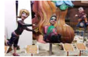
JUNIO - JUNE Hogueras de San Juan.