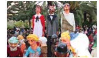
DICIEMBRE - DECEMBER Fiestas Patronales en honor a la Inmaculada Concepción.