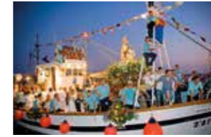
JULIO - JULY Fiestas en honor a la Virgen del Carmen.