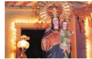
OCTUBRE - OCTOBER Torrelamata, Fiestas en honor a la Virgen del Rosario.