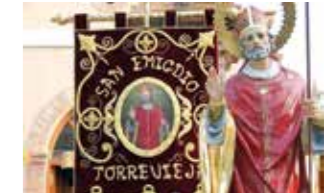
AGOSTO - AUGUST Barrio del Calvario, fiestas en honor a San Emigdio.