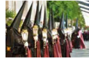
MARZO / ABRIL MARCH / APRIL Semana Santa.