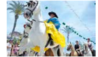
MAYO - MAY Feria de Sevillanas.