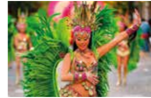
FEBRERO - FEBRUARY Carnaval.