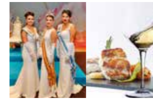
NOVIEMBRE - NOVEMBER Elección de la Reina de la Sal. Ruta de la Tapa.