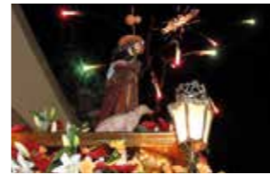
AGOSTO - AUGUST Fiesta en honor de San Roque.