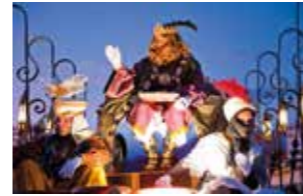
ENERO - JANUARY Cabalgata de Reyes.