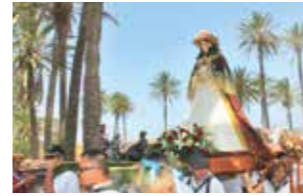
JUNIO - JUNE Romería en honor a la Virgen del Rocío y Festividad del Sagrado Corazón de Jesús.